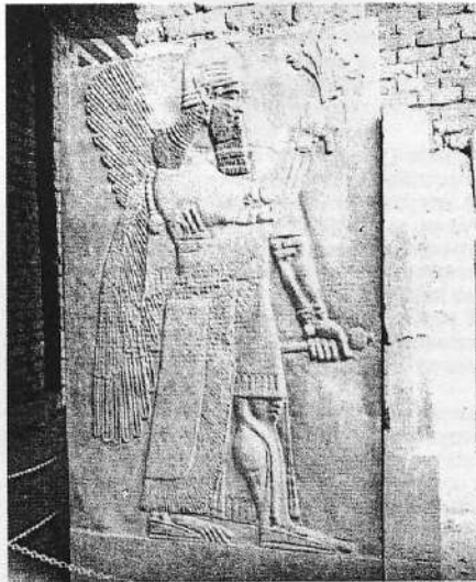
Ανάγλυφο της Χαλάνης με αναπαράσταση πτερωτού προστατευτικού της πόλης δαίμονα.

γονότα και ιδιαίτερα στη μάχη του Καρκάρ (853). Ανάμεσα στους φόρου υποτελείς βασιλείς αναφέρεται και ο Γιεχού, βασιλιάς του Γιοουντί (Ιούδα, Ν. κράτους των δυο φυλών). Σήμερα ο «Μαύρος Οβελίσκος» βρίσκεται στο British Museum.